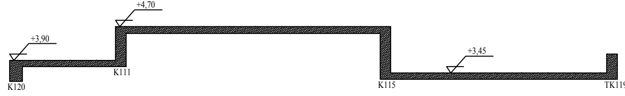
B-B kesiti (1/50)